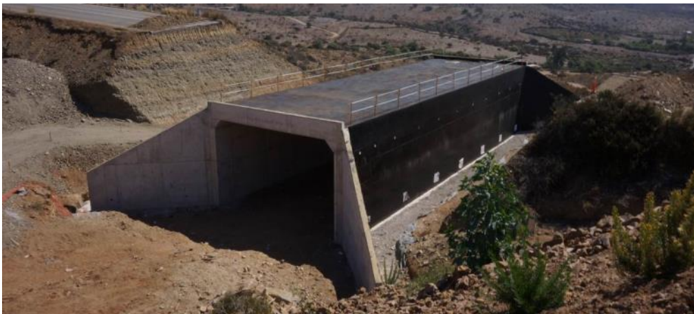
Imagen N°06. Dm 39.795 Atravesio El Tototal