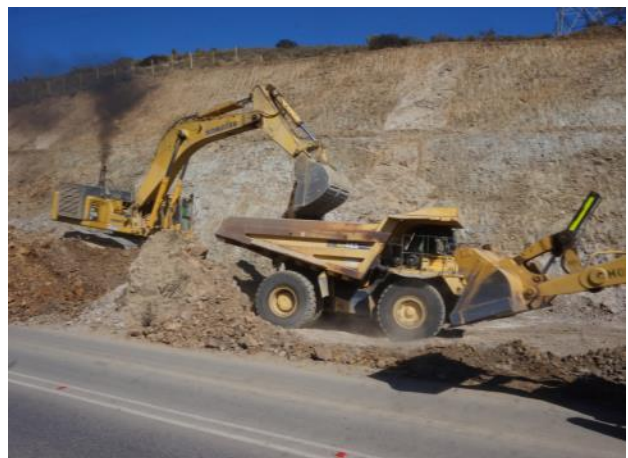
Imagen N°04 Trabajos de Corte Las Cardas