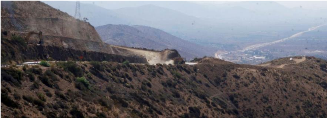
Imagen N°01. Corte cerro Las Cardas