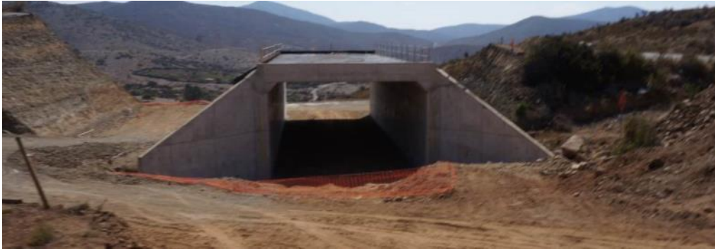
Imagen N°05. Dm 39.795 Atravesio El Tototal