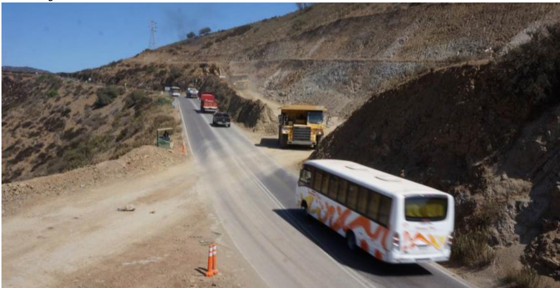
Imagen N°02 Corte cerro Las Cardas