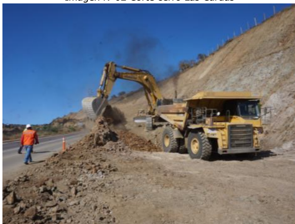
Imagen N°03 Trabajos de Corte Las Cardas