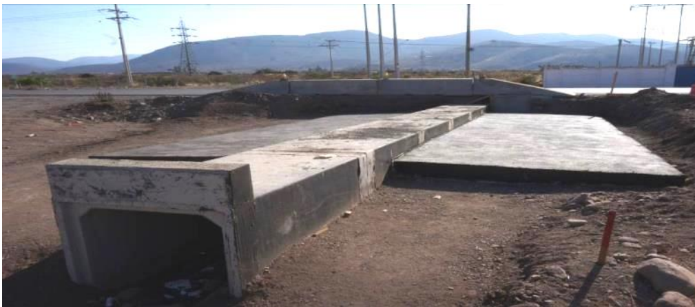
Imagen N°7. Instalación cajón Prefabricado