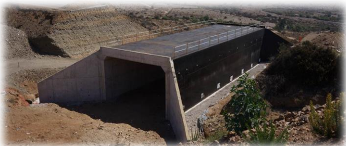
Atravesio El Total

Tramo 4: Avenida Las Torres se ejecutara calzada simple entre Av. La Cantero y Av. Balmaceda.